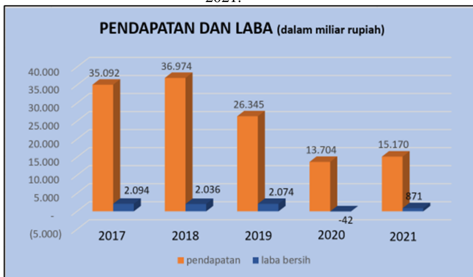
Gambar 1. Pendapatan dan Laba Rugi PT. Jasa Marga (Persero) Tbk tahun 2017-2021.

Sumber : Laporan keuangan PT. Jasa Marga yang telah diolah.